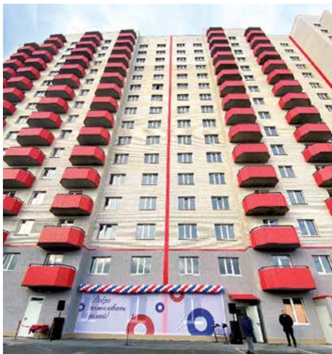
Город Ростов-на-Дону, ул. 1-я Баррикадная, 24, позиция 1Б.