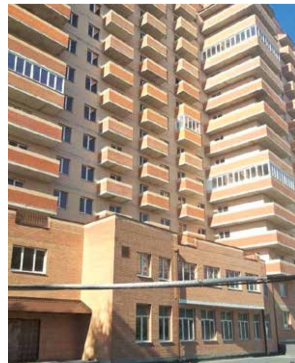
Город Аксай, ул. Мира, 1.

Ежемесячная рекламно-информационная газета «Парламентский вестник Дона»