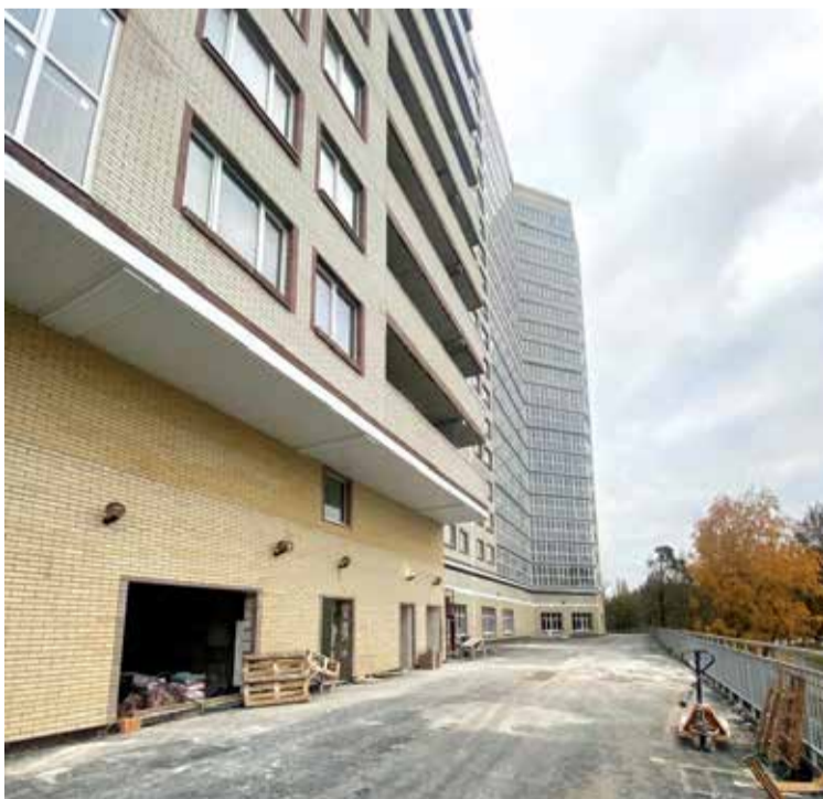
Город Ростов-на-Дону, ул. Зорге, 9.